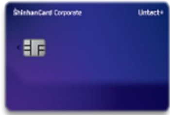
신한법인 Untact+ 카드