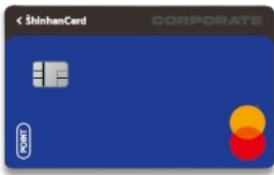
Business Trip T&E 카드