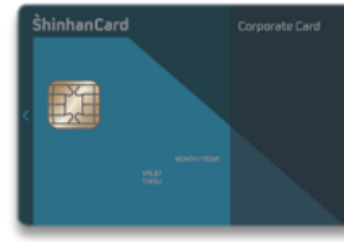
Platinum Extension 카드

웅진코웨이, LG전자 케어솔루션, 바디프랜드, SK매직, 교원웰스, 넥센타이어, 쿠크홈시스