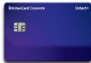
신한법인 Untact+ 카드